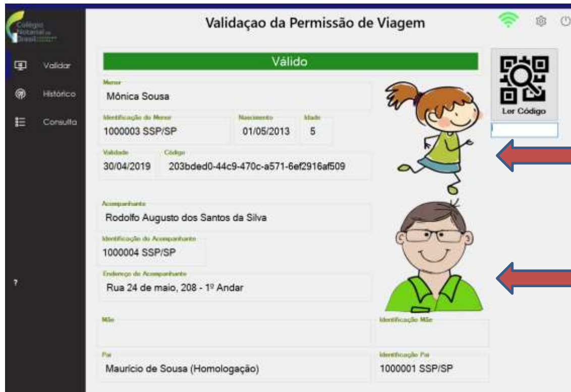
Imagem do menor & Imagem do responsável