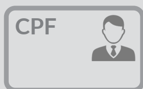
Identificação com foto e CPF