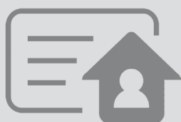
Comprovante de residência