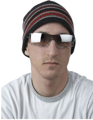
Foto com chapéu, boné, óculos de sol