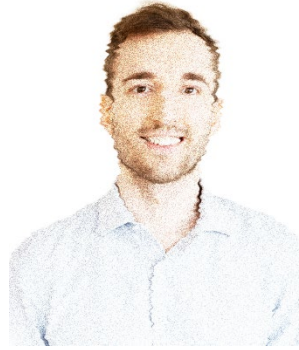
Foto tratada ou estilizada