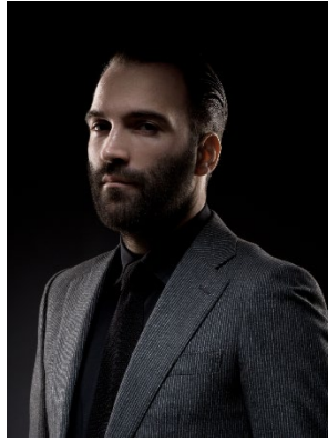
Fotos escuras e sem enquadramento correto