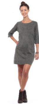
Foto de corpo inteiro